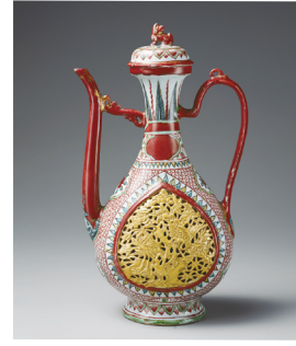
重要文化財 五彩透彫水注(金襴手) 景德鎮窯 磁器/一合 高28.2cm 口径5.9cm 底径8.3cm 中国 明時代・16世紀

安定感のある太い胴に細長い頸が付いた瓶で、頸には一対の鳳凰をかたどった耳がついています。数々の優品を焼造した浙江省龍泉窯の青磁です。龍泉窯のこの形の瓶は花生として日本で大変好まれ、同時代の鎌倉時代はもとより、焼造が終了している室町時代になっても中国から輸入したほどの人気を博しました。本作品は類品の中でもっとも大きく、その色調とともに堂々とした姿が大変魅力的です。