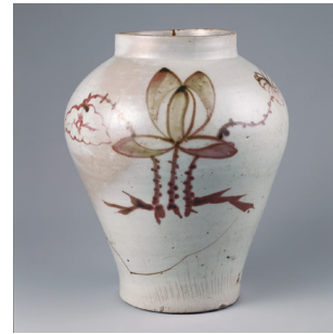
辰砂蓮花文壺 磁器/一口 高29.2cm 口径12.9cm 底径13.5cm 朝鮮時代・18~19世紀 五島美術館蔵

器の表面に白化粧を施し、その白化粧を搔落として牡丹の文様を描いています。さらにその上に掛けられた釉薬が青みを帯びて美しく発色しています。扁壺は器を前後から押しつぶしたように扁平になった形の壺で、朝鮮時代には数多く造られました。中国のやきもののような端正な姿ではなく、朝鮮時代のやきものに特徴的な少し歪んだ姿で、そこに大らかな牡丹の文様が表裏面に描かれ、大変親しみを覚えます。