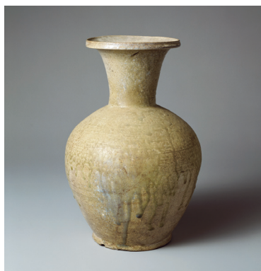
白瓷長頸瓶 猿投窯