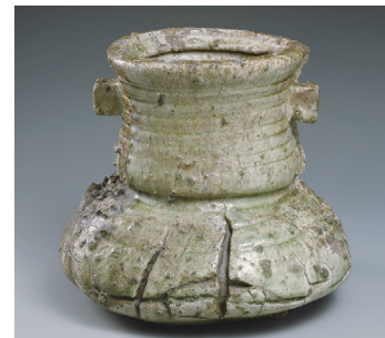
重要文化財 古伊賀水指 銘 破袋 陶器/一口 高21.4cm 口径15.2cm 胴径23.7cm 底径18.0cm 五島美術館蔵 桃山時代・17世紀初期

鼠志野は美濃(岐阜県南部)で焼造された美濃焼の一種で、鬼板と呼ばれる鉄分を含む化粧土と、白く発色する志野釉により、鼠色に発色させたやきものです。伝世する鼠志野の茶碗は10碗ほどで、その中でも巧みな成形と鋭い造形を示す秀逸な茶碗です。銘の「峯紅葉」は、赤味がかった釉調と山道と呼ばれる起伏のある口の形状から付いたものとされます。「峯紅葉」という銘が、作品をより魅力的なものとしています。