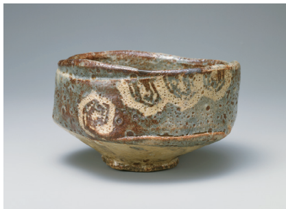
重要文化財 鼠志野茶碗 銘 峯紅葉 陶器/一口 高8.9-7.6cm 口径14.0-13.5cm 底径6.1-5.9cm 重量487.4g 桃山時代・16世紀末期~17世紀初期 五島美術館蔵

辰砂は、透明釉の下に銅を呈色材とした絵具で文様を描いて焼成したやきものです。釉薬の上に文様を描く五彩とは異なり、一度の焼成で文様を紅色に発色させるため、鮮やかな色を出すには高い技術が必要です。本作品では、大らかな蓮の花と葉が鮮やかに発色し、ほのかに赤味を帯びた白磁に美しく映えています。朝鮮時代の白磁辰砂の魅力を存分に味わえる作品です。