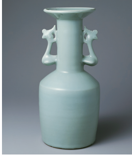
重要文化財 青磁鳳凰耳瓶(砧青磁) 龍泉窯 磁器/一口 高33.5cm 口径13.1-13.0cm 胴径15.5cm 底径13.2cm 中国 南宋時代・13世紀 五島美術館蔵

安定感のある太い胴に細長い頸が付いた瓶で、頸には一対の鳳凰をかたどった耳がついています。数々の優品を焼造した浙江省龍泉窯の青磁です。龍泉窯のこの形の瓶は花生として日本で大変好まれ、同時代の鎌倉時代はもとより、焼造が終了している室町時代になっても中国から輸入したほどの人気を博しました。本作品は類品の中でもっとも大きく、その色調とともに堂々とした姿が大変魅力的です。