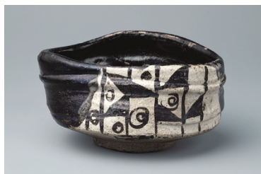
黒織部杓形茶碗 銘わらや