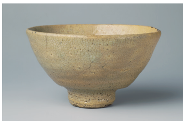
重要美術品 井戸茶碗 銘美濃