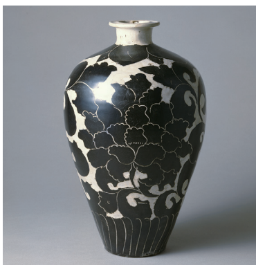
重要美術品 白釉黒花牡丹文梅瓶 磁州窯