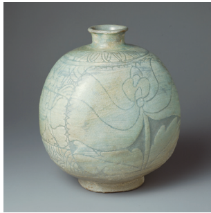
粉青搔落牡丹文扁壺 陶器/一口 高19.6cm 口径4.9cm 底径8.7-8.2cm 朝鮮時代・15世紀 五島美術館蔵

白磁として一度焼成した器の上に、赤や緑、黄色に発色する絵具で文様を描いてもう一度低い温度で焼成したやきものを、中国では「五彩」と呼びます。本作品は胴部に牡丹孔雀図の透かしを入れた上に黄釉を掛け、さらに金彩を施すなど手間暇をかけた丁寧な作りとなっており、類品は極めて少数です。器全面に描かれた緻密な文様が、下膨れの器の形に調和した大変優美な作品です。